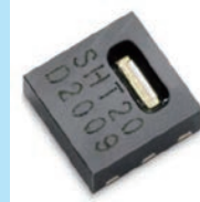
高精度湿度センサー (Sensirion 製)

湿度設定は 0.1%RH 単位で可能 湿度表示範囲 0.0 ~ 99.9%RH 湿度設定範囲 1.0 ~ 99.9%RH